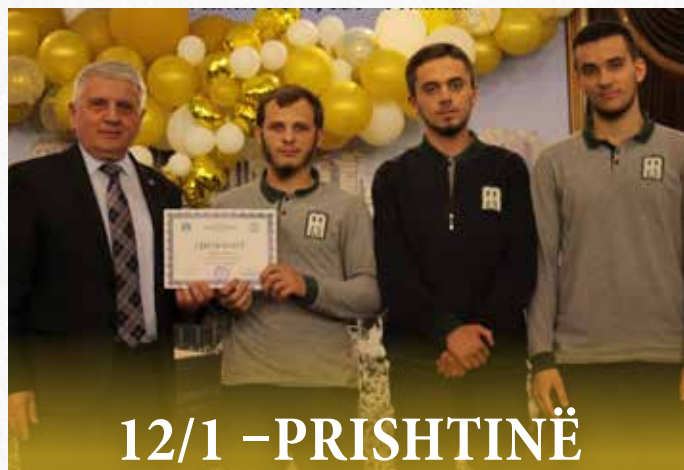
12/1 - PRISHTINË