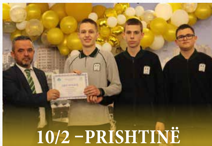
10/2 - PRISHTINË