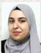
DUA OMEGA 11/4