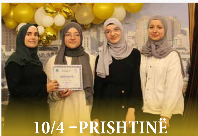
10/4 - PRISHTINË