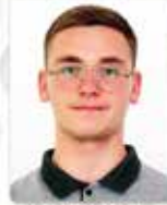
AMER SUMA 12/2 më i dalluari në nivel shkollë