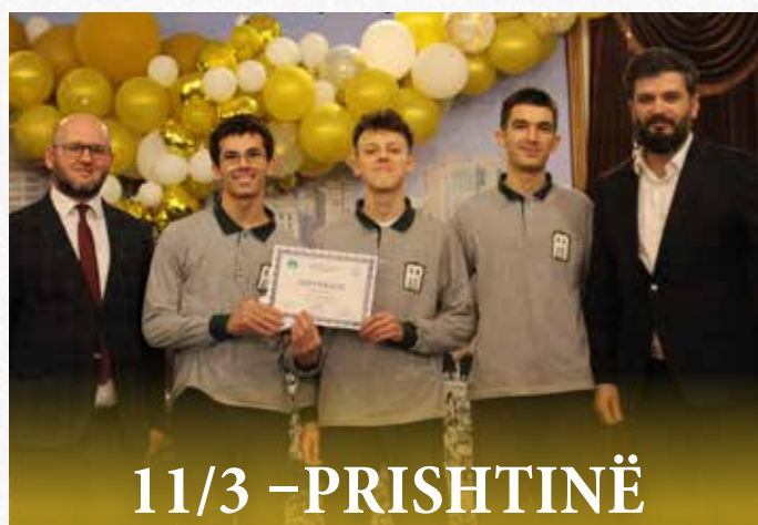
11/3 - PRISHTINË