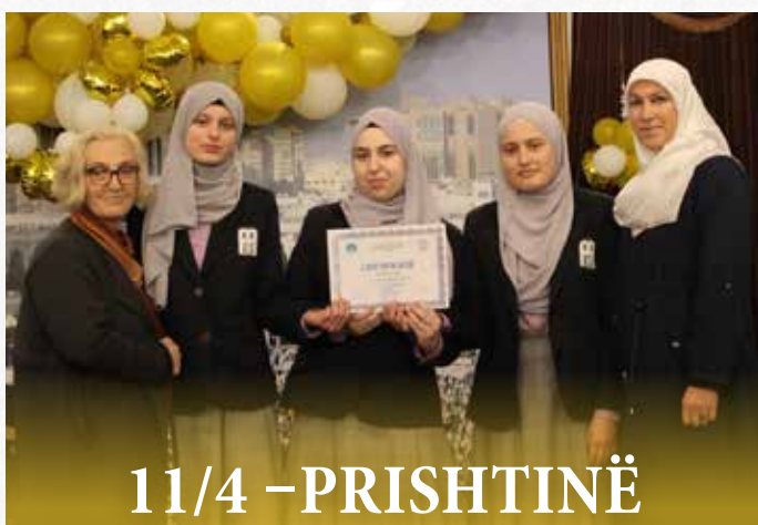
11/4 - PRISHTINË