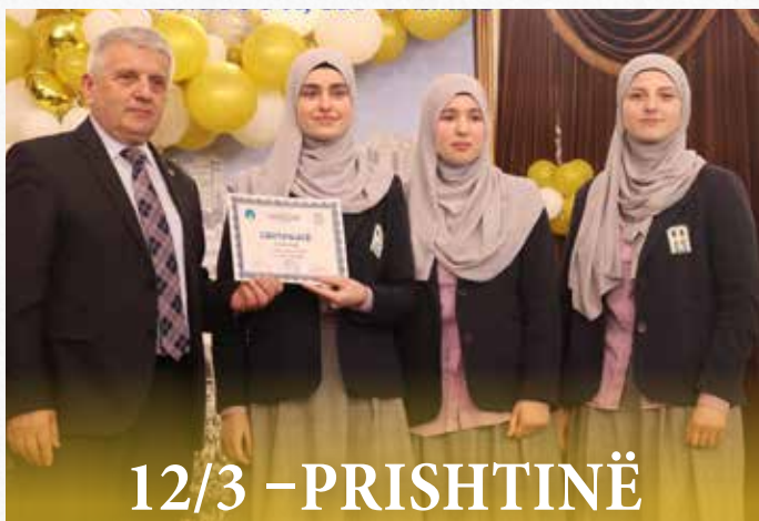
12/3 - PRISHTINË